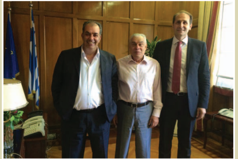
Σε μία από τις επισκέψεις μας στο Υπουργείο Ανάπτυξης, μαζί με το Βουλευτή Ημαθίας, κ. Απόστολο Βεσυρόπουλο, ο οποίος πάντα στέκεται αρωγός στις προσπάθειες που καταβάλλουμε για τον κλάδο μας.

τη διαμόρφωση της τροπολογίας και του Προεδρικού Διατάγματος. Σκοπεύουμε να εργασθούμε ακόμη πιο σκληρά, προκειμένου να παραμείνουμε στο προσκήνιο και να καθορίσουμε ΕΜΕΙΣ το μέλλον του κλάδου μας. Δεν θα επιτρέψουμε να ληφθεί καμία απόφαση ΕΡΗΜΗΝ ΜΑΣ. Ευελπιστούμε στην αμέριστη συμπαράσταση όλων των μελών μας, μιας και η στήριξή σας είναι αυτή που μας δίνει το κουράγιο να συνεχίσουμε, σε ένα δύσκολο αγώνα από τον οποίο κρίνεται το μέλλον το δικό μας και των παιδιών μας.