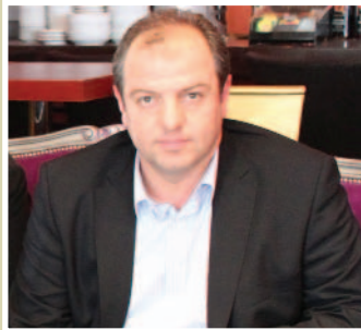
Αρωγός στις προσπάθειές μας για το Νόμο ο κ. Διονύσης Σταμενίτης, Βουλευτής του Νομού Πέλλας. Τον ευχαριστούμε ιδιαίτερα για τη στήριξή του.

Αγαπητοί συνάδελφοι, βρισκόμαστε ακόμη και σήμερα σε συνεχείς διαπραγματεύσεις για όλα τα θέματα που αφορούν τον πολύκροτο νόμο 4264. Αναμένεται ακόμη νέα επίσκεψή μας στο Υπουργείο Ανάπτυξης, προκειμένου να μπορούμε στην τελική ευθεία για